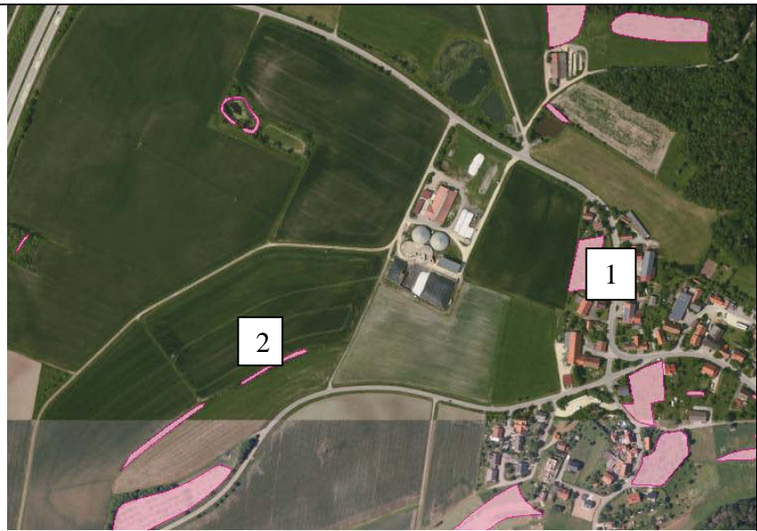
Luftbild mit umliegenden Biotopen